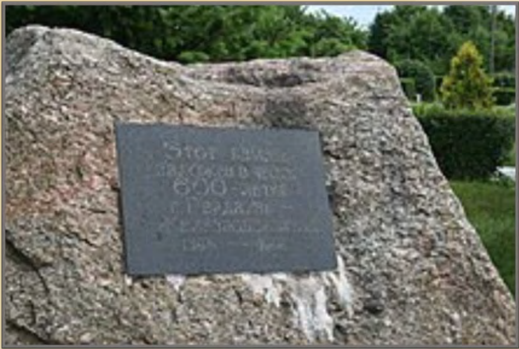
Памятник в честь 600-летия Железнодорожного/Гердауэна.