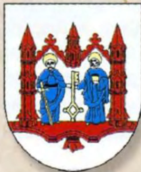
Гердауен 1389 год